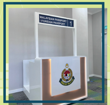
Mock Counter di Bilik Simulasi (CoE)