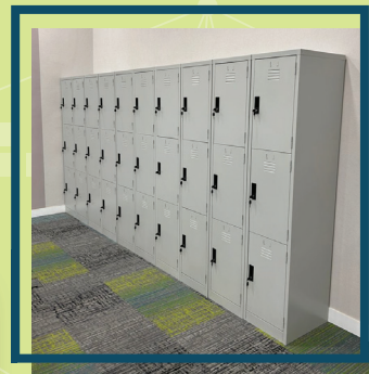
Pemasangan Locker di Bilik Latihan ICT (CoE)