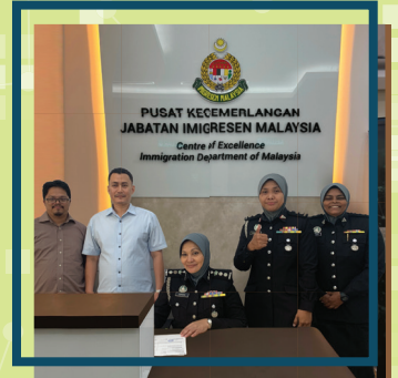
Sesi Menandatangani Sijil Perakuan Ujian Penerimaan Pengguna