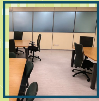
Penukaran Vinyl Flooring di Ruang Makan Bilik Latihan ICT BTMR